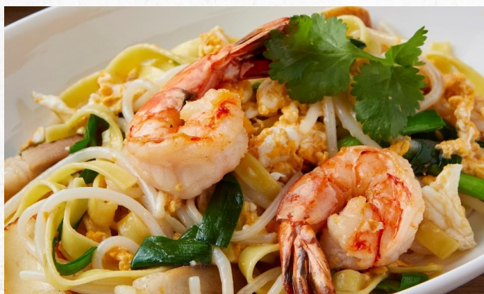
XOソースの海鮮焼きそば ¥1,550 FRIED XO SAUCE SEAFOOD NOODLES (税込)

全てのメインメニューに¥250 (税込) 追加でコーヒー、紅茶もしくはジュースを付けられます。 With every main dish order, add ¥250 (tax included) for a coffee, tea, or juice.