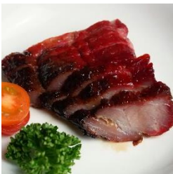
蜜汁チャーシュー HONEY ROASTED PORK CHAR SIEW ¥880 (税込)