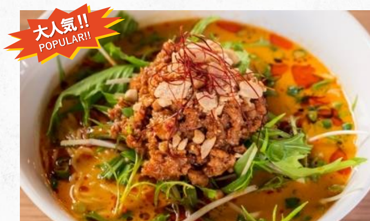
担々麺 ¥1,450 DANDAN NOODLES (税込)

日本では珍しい広東風の担々麺です！ピーナッツベースのタレと鶏だしスープに、香港麺を合わせた逸品です。