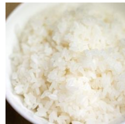
白ご飯 WHITE RICE ¥210 (税込)