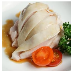
海南チキン HAINANESE CHICKEN ¥1,080 (税込)