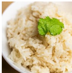
鶏だし炊込ごはん FRAGRANT CHICKEN RICE ¥280 (税込)