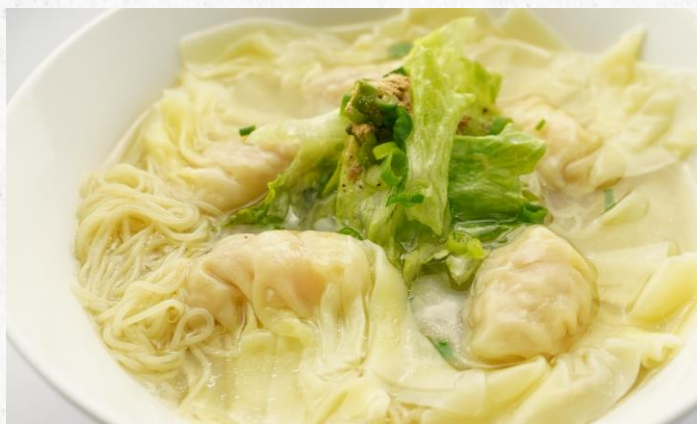
ワンタン麺 ¥1,300 WONTON NOODLE SOUP (税込)

新鮮エビワンタンと鶏だしの組み合わせは絶品！！鶏だしで炊いたお米を、炒飯にするひと手間をかけてます。