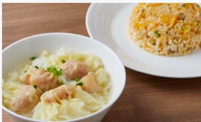
ワンタンスープと鶏だし炒飯セット ¥1,550 WONTON SOUP WITH FRIED RICE (税込)

特大のエビが自慢！！玉子の黄身と白身を別々に焼き上げるひと手間を加えた絶品炒飯です。