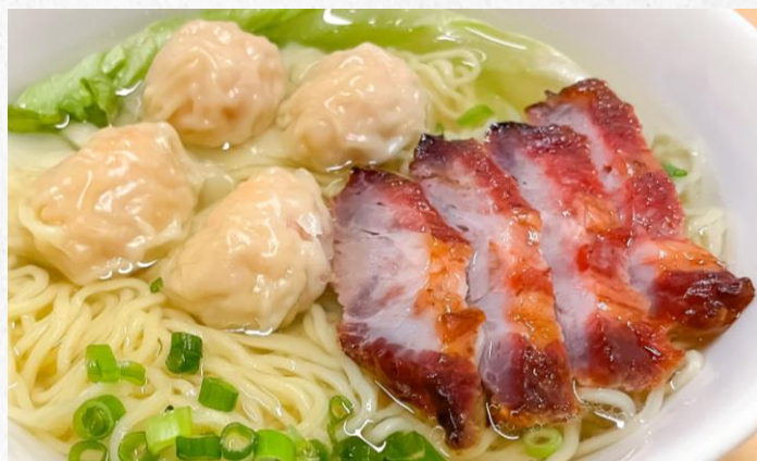
ワンタンチャーシュー麺 ¥1,400 WONTON CHAR SIEW NOODLE (税込)