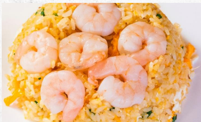
エビ炒飯 ¥1,450 SHRIMP FRIED RICE (税込)

日本では珍しい広東風の担々麺です！ピーナッツベースのタレと鶏だしスープに、香港麺を合わせた逸品です。